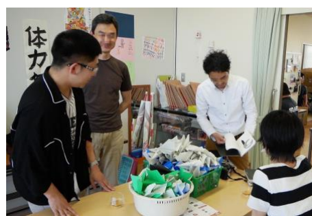
図 1 ふれ愛の家訪問