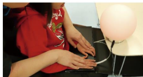
図 4 mooth 体験の様子

その後、先生との意見交換から身体機能回復をねらったスヌーズレン装置 (mooth) を提案して、試してもらいそれらのフィードバックをもらった。