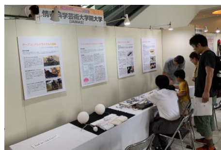
図 6 ロボフェス おおがき 2019