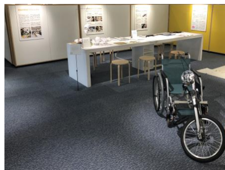
図 2 オープンハウスでの展示