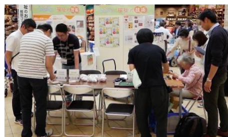
図 5 モレラ岐阜でのイベント